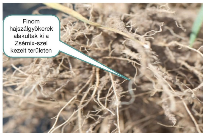
2 x 2,0 liter/ha Zsémix